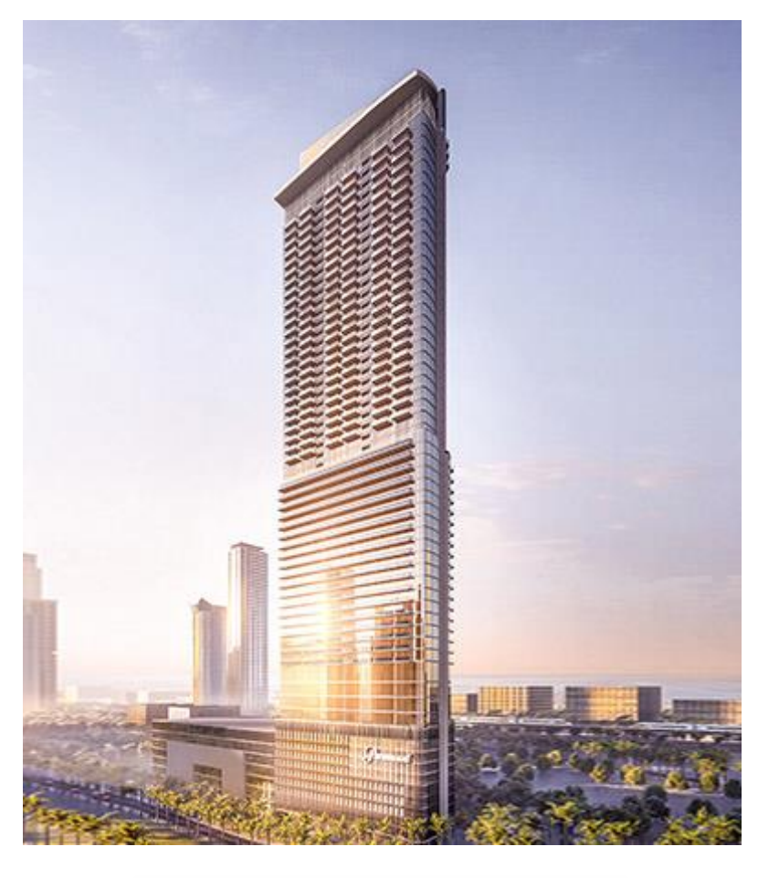
Paramount Tower Hotel & Residences